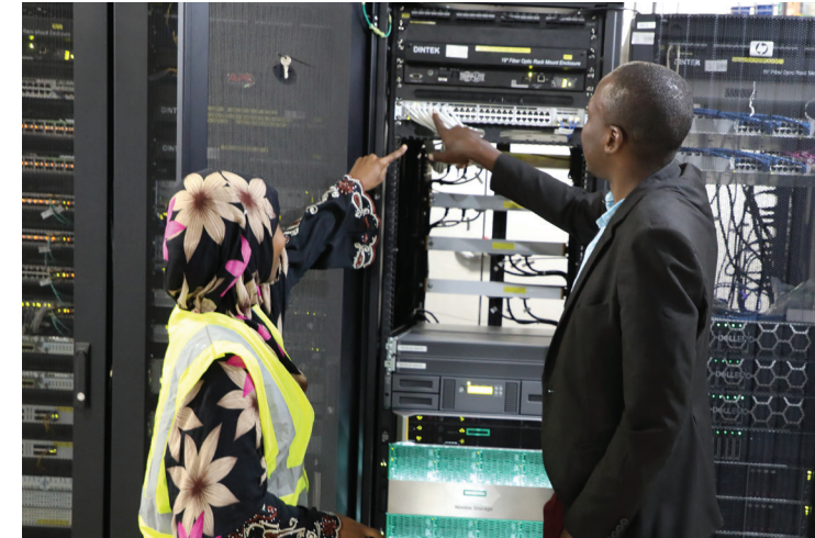
Wahandisi kutoka ZICTIA wakiendelea na kazi katika Kituo cha Taifa cha kuhifadhia Taarifa (Data Center) Zanzibar.